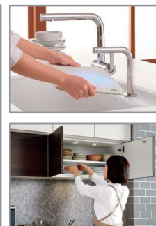
きれい除菌水／周辺ユニット

その他多数の商品が対象となります！詳細はTOTOホームページ、またはショールームへお問い合わせください。