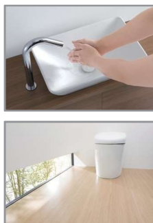
レストルームドレッサー(自動水栓付)／ハイドロセラ・フロアJ