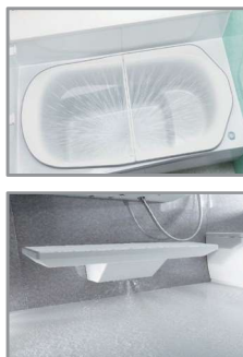
おそうじ浴槽／床ワイパー洗浄(きれい除菌水)