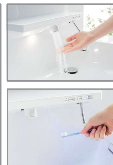
自動水栓／きれい除菌水