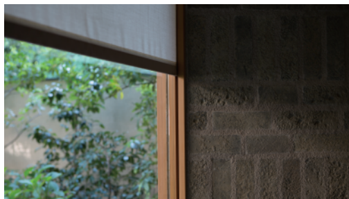
「帝塚山のセミコートハウス」のロールスクリーン枠まわり。

天井裏に取り付けられたロールスクリーンが木枠の溝をガイドレールとして降りてくる。端部の固定により、障子のような断熱性能も期待できる。