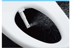
写真 [ワイドビデ洗浄] 約1/250,000秒高速撮影