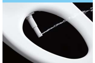
写真 ワンダーウェーブ[ビデ洗浄] 約1/250,000秒高速撮影