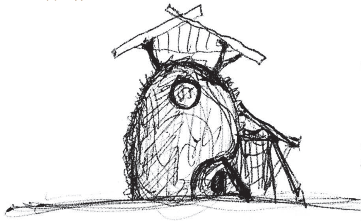
[ スケッチ 2 ]