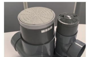
通気口付き蓋へ交換しています。