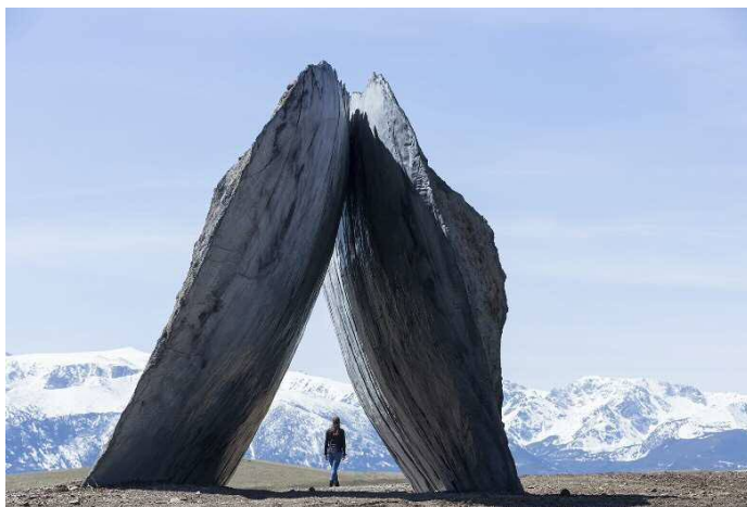
ランドスケープの構造体 インバーテッド・ポータル（裏返された門）米国／2016年 ©Iwan Baan

人の暮らしの質の向上を目指し、地球規模の視点からデザインと現代の技術を融合させ、時代に即した建築や都市の構築方法を提案しています。ランドスケープの構築や住宅のプレファブリケーションなど、多様な取り組みを行っています。