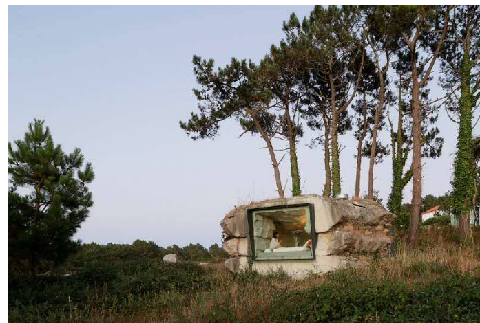
トリュフ（スペイン／2010年）