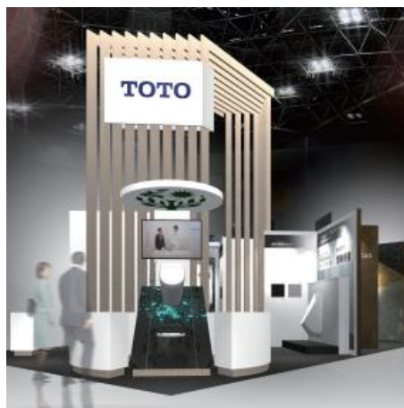
ブース外観[イメージ]

今回は、パブリック向けハイドロセラ・フロアの新商品を中心にご紹介。ハイドロテクトの防臭・防汚効果を体感頂けるコーナーもご用意します。この機会に是非、お立ち寄りください!