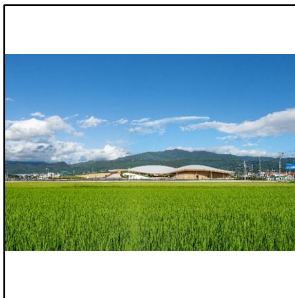
[4] シェルターインクルーシブプレイス コパル (山形県、2022年)