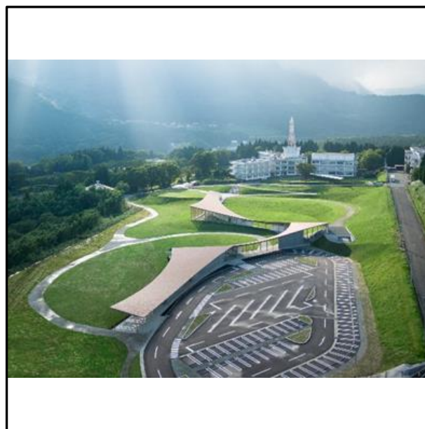
[2] 熊本地震 震災ミュージアム KIOKU (熊本県、2023年)