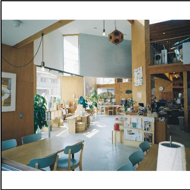
[5] Good Job! Center KASHIBA (奈良県、2016年) ©Yuma Harada