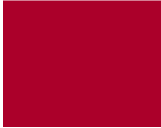
本体 - 色変更側面