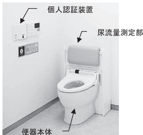
図-2 尿流量測定装置・フロースカイの外観