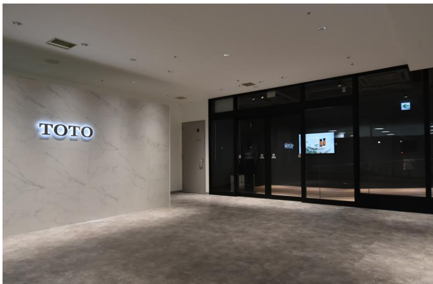
「TOTO神戸ショールーム」

※2 TOTOがおすすめする「あんしん」の増改築工事会社ネットワーク加盟店です。リモデルプランの提案や施工からアフターサービスまで総合的にお手伝いします。