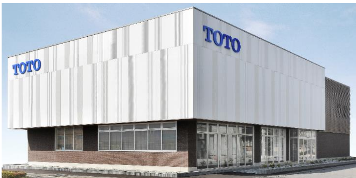
「TOTO宇都宮ショールーム」外観

※2:TOTOがおすすめする「あんしん」の増改築工事会社ネットワーク加盟店です。リモデルプランの提案や施工からアフターサービスまで総合的にお手伝いします。