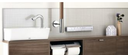
グレー（モザイクタイル調）