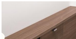
M サイズ(幅 150 mm)

トイレの広さに合わせて、カウンターの奥行きサイズがSサイズ(95 mm)とMサイズ(150 mm)の2種類から選べます。