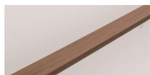
S サイズ(幅 95 mm)