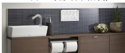
インディゴブラック（モザイクタイル調）

インテリア性を高め、壁のお手入れが簡単になるアクセントパネルを品揃えしました。パネル、フレームは現場でカットし壁から壁までの対応が可能です。