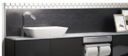
シャドウブラック