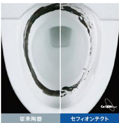
洗浄前 疑似汚物を塗布した段階でセフィオンテクトは汚れをはじき始めています。

陶器表面の凹凸を100万分の1mmのナノレベルでなめらかに仕上げているので、汚れがツルっと落ち、美しさが持続します。また、親水性が高く、水になじみやすいので、汚物を流れやすくします。