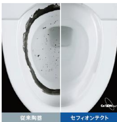
洗浄後 セフィオンテクトは汚れがきれいに落ちます。