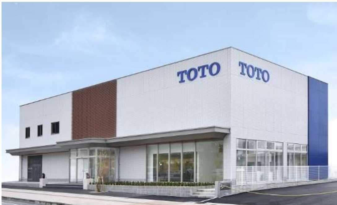
「TOTO沖縄ショールーム」外観写真

※1: TOTO がおすすめする「あんしん」の増改築工事会社ネットワーク加盟店です。リモデルプランの提案や施工からアフターサービスまで総合的にお手伝いします。