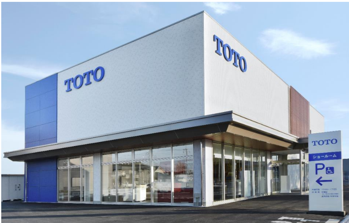
「TOTO水戸ショールーム」外観写真

※1:TOTOがおすすめする「あんしん」の増改築工事会社ネットワーク加盟店です。リモデルプランの提案や施工からアフターサービスまで総合的にお手伝いします。