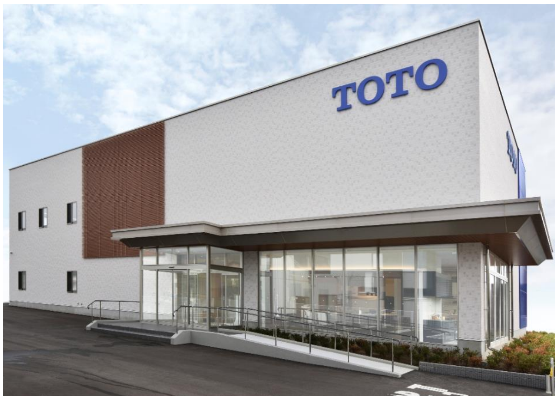
「TOTO長野ショールーム」外観写真

※1:リモデルプランの提案や施工からアフターサービスまで総合的にお手伝いする、日本最大級の増改築工事会社ネットワークです。