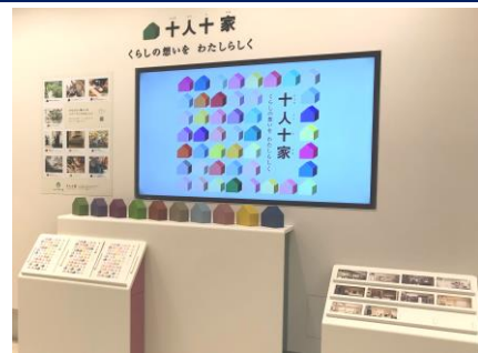
TDY 新宿コラボレーション SR「十人十家」ギャラリー

あこがれの 10 の暮らし方プランのリモデルポイントや、採用商品概要などの情報を掲載した「“十人十家”コレクションブック」を配布するほか、コンセプトをまとめたムービーの放映も行います。360° パノラマ動画も用意し、スマートフォンと VR ヘッドセットを用いることで VR での視聴も可能。空間の中に入り込んだような臨場感を体験いただけます。