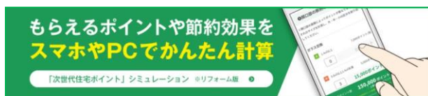
「次世代住宅ポイント」シミュレーション リフォーム版

「次世代住宅ポイント制度」対象の TDY 商品を、リフォーム内容や付与ポイントと共に紹介した「次世代住宅ポイント制度活用ガイド リフォーム編」を配布します。また、もらえるポイントや節約効果をスマートフォンや PC でかんたんに計算できるコンテンツ「ポイントシミュレーション リフォーム版」も紹介し、「次世代住宅ポイント制度」の活用方法を提案します。