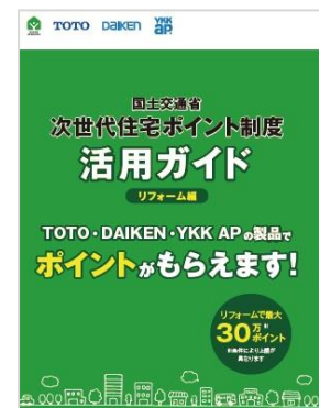
「次世代住宅ポイント活用ガイド リフォーム編」表紙

https://re-model.jp/about/jisedajutakupoint/simulation/