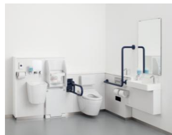
コンパクト多機能トイレパック(TOTO)

■入居者・来館者のためのトイレ・浴室・エントランス空間:限られたスペースの中で車いす配慮、オストメイト配慮、そして乳幼児連れにも配慮したトイレを設置。介助のしやすさと安全性に配慮した浴室や、エントランス空間を美しく演出するシンプルデザインの洗面カウンターをご紹介します。