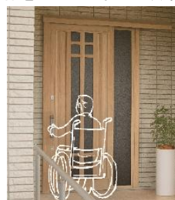
ドアリモ アウトセット玄関引戸 (YKK AP)