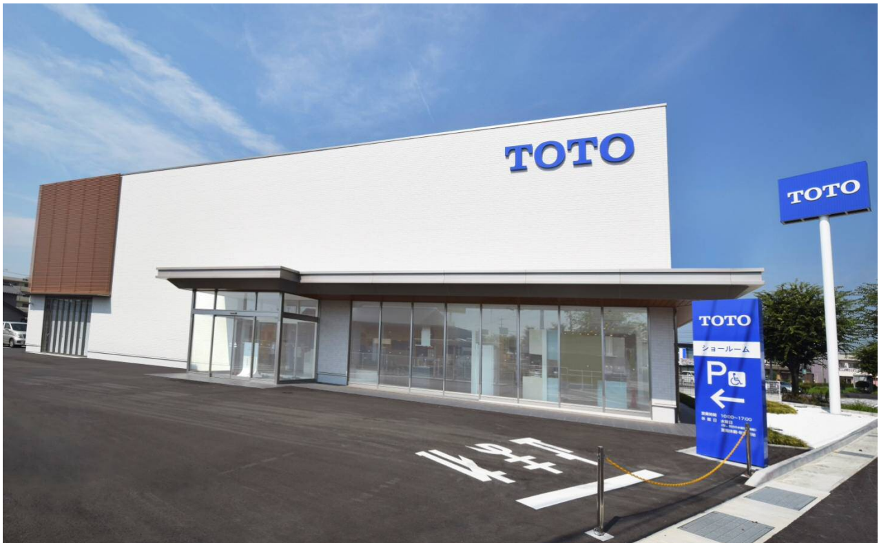
「TOTO津ショールーム」外観写真

※1:リモデルプランの提案や施工からアフターサービスまで総合的にお手伝いする、日本最大級の増改築工事会社ネットワークです。