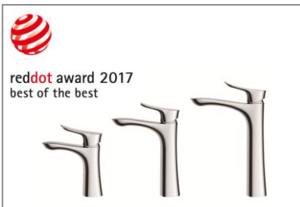
レッドドットデザイン賞 ベスト・オブ・ザ・ベスト受賞 台付き混合水栓「GO シリーズ」