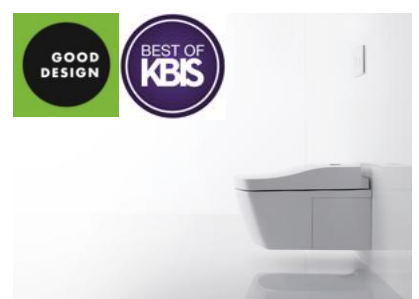
GREEN GOOD AWARD 2016 受賞 BEST OF KBIS 受賞 「NEOREST AC」

(*1)ISH 2017(International Sanitary and Heating 2017)