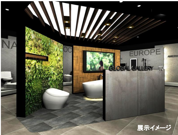
【ISH2017展示】 ネオレスト NX や FLOATATION TUB を展示。

ISH2017(*1)の展示を中心に最新の商品を紹介しします。ウォシュレット(*2)一体形便器「ネオレスト NX」や世界のデザイン賞で権威のある「レッドドットデザイン賞」において最優秀賞の「ベスト・オブ・ザ・ベスト」を受賞した台付き混合水栓「GO シリーズ」、同じく世界的に権威のある iF デザイン賞で最優秀賞のゴールド賞を受賞した「Washbasin」(ベッセル式洗面器)を展示。また環境配慮に優れたデザインに与えられる世界的な賞である、「GREEN GOOD DESIGN AWARDS 2016」を Green Corporate 部門と米国最大の水まわり展示会 KBIS(Kitchen and Bath Industry Show)においてバスルーム部門ゴールド賞を受賞した NEOREST AC を展示しています。他にも新しい発想で入浴文化を脳科学により追求した浴槽「FLOATATION TUB」など、海外市場で展開する TOTO の最高峰の商品をご覧ください。