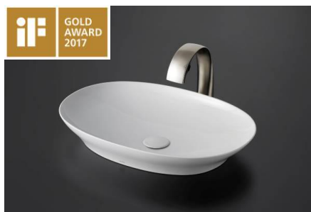
iF デザイン賞ゴールド賞受賞 「Washbasin」(ベッセル式洗面器)