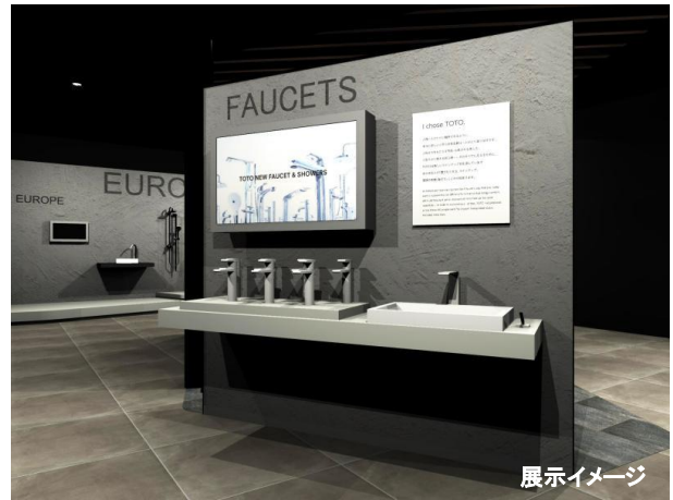
【グローバル水栓展示】 グローバルに展開する水栓金具を展示。