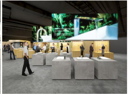
【水栓金具・洗面器】 多数の水栓バリエーションと洗面器の組合せを展示

TOTO は 2008 年に欧州事業を本格的にスタート。事業統括会社「TOTO Europe GmbH」をドイツ・デュッセルドルフ市内に設立しました。