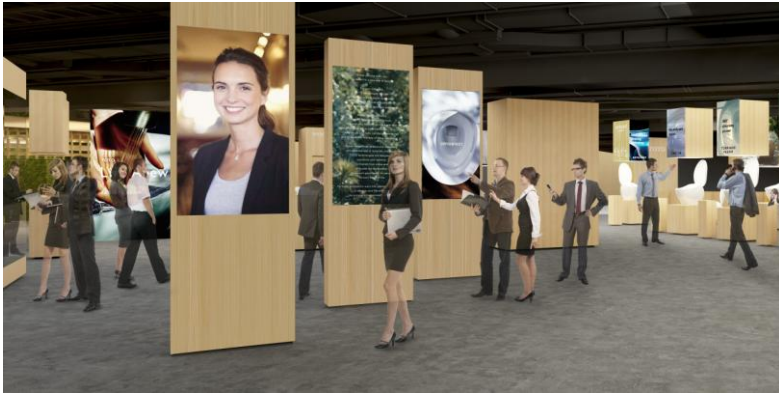
【ISH2017 展示コンセプト Life Anew】 TOTO のフィロソフィーを表現