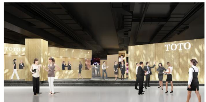
右：【TOTO ブースエントランス】