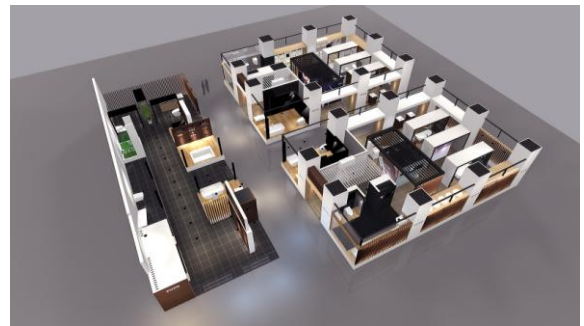
【TOTOブランドを象徴する NEOREST SUITE 空間展示／528㎡を誇る TOTO ブース】