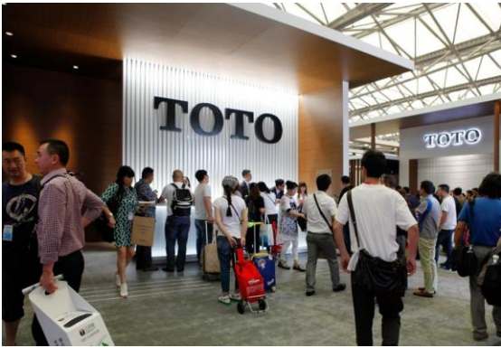
メイン会場すぐに位置する TOTO ブース