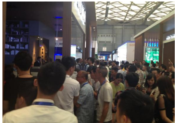
混雑する TOTO ブース