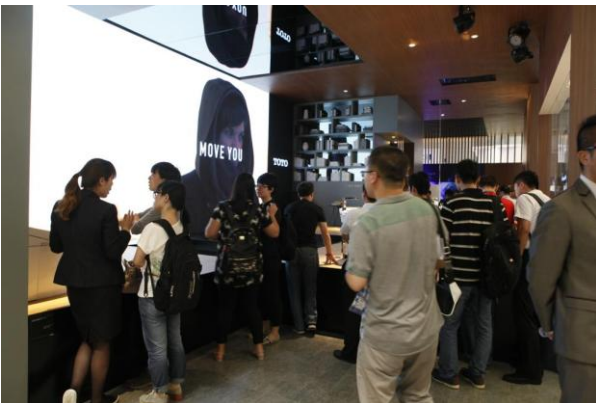
「TECHNOLOGY TO MOVE YOU」メインステージ