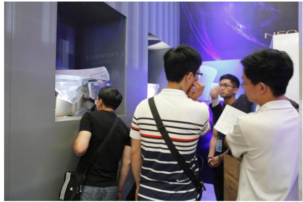
半割れの節水便器の仕組みに見入る来場者