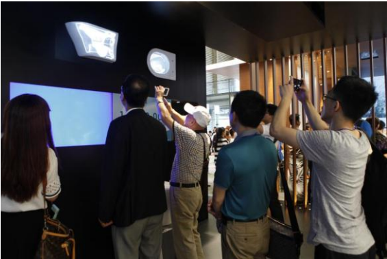
節水の仕組みを特殊映像でみせたプロジェクションマッピングコーナー