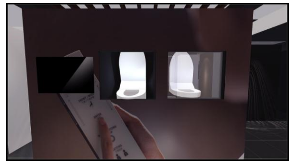
【NEOREST、ウォシュレットの技術を体感できるコーナー】