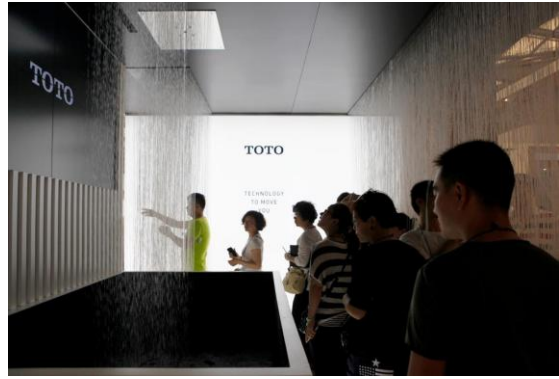
シャワーコーナー