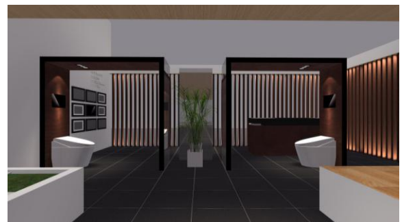
【シャワーの技術展示／世界に広がるネオレストを空間で再現】