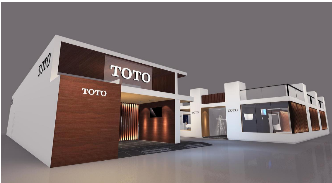
【Kitchen & Bath 2016 TOTO展示イメージ】

TOTO では今後ともさらに多くのお客様に、ウォシュレットをはじめとする TOTO オリジナルのテクノロジーがお客様にもたらすベネフィットを世界各地で発信してまいります。