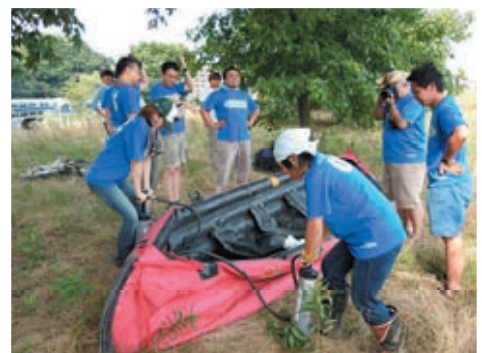
ボートは女性2人でも簡単に空気を入れられる