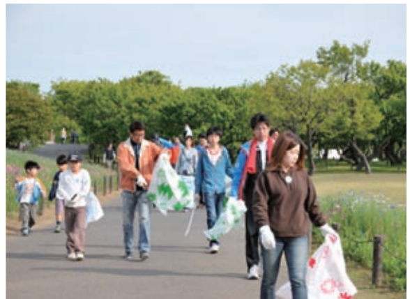
ゴミ拾いの後に楽しいイベントがある「キモチいいゴミ拾い」