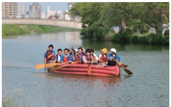
実際に試乗してボートで行う自然や歴史の話等の説明を受けた