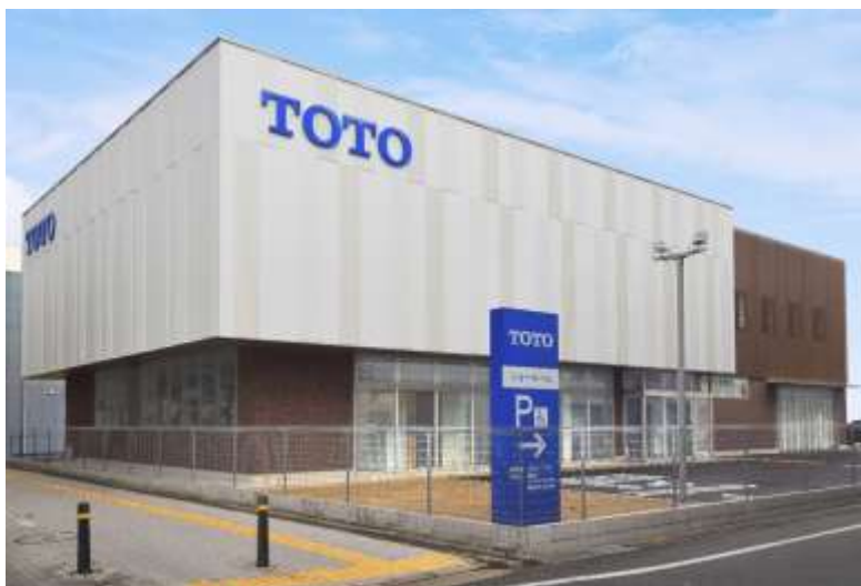
「TOTO姫路ショールーム」外観

※2: TOTOがおすすめする「あんしん」の増改築工事会社ネットワーク加盟店です。リモデルプランの提案や施工からアフターサービスまで総合的にお手伝いします。