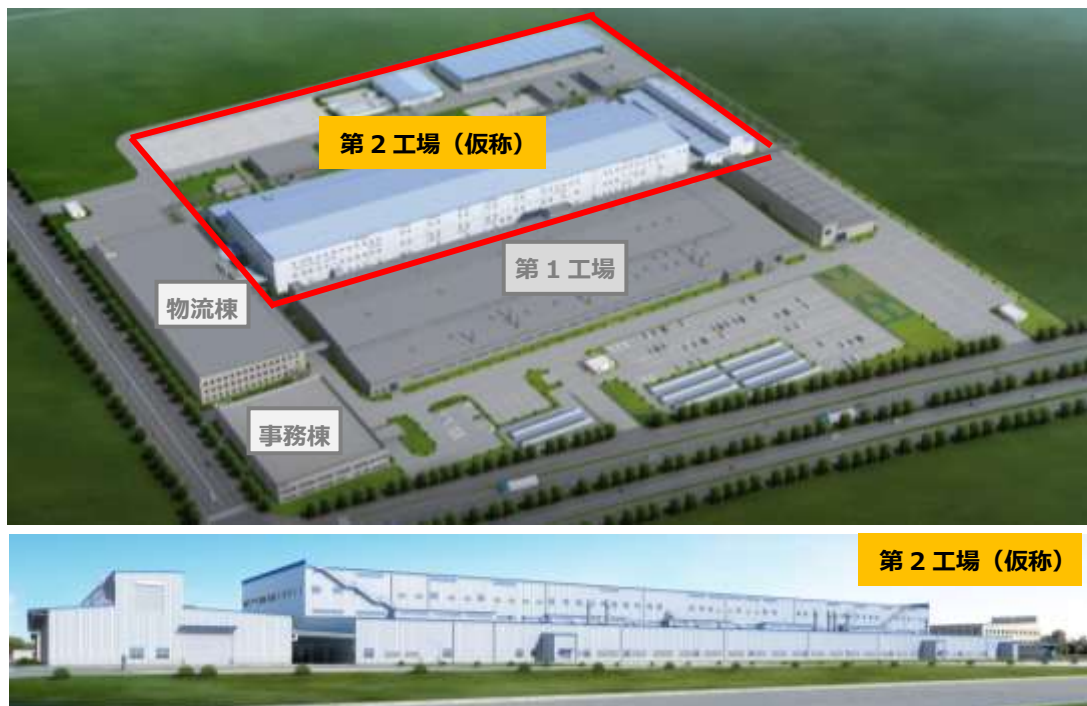
東陶(福建)有限公司 第2工場(仮称)の外観イメージ

第2工場(仮称)は衛生陶器の量産工場と位置づけ、2021年4月からの本格稼働を目指します。