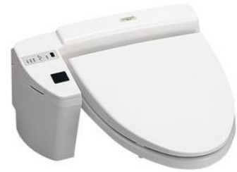
「Premium 10」展に展示される「ウォシュレット GA」

※詳細は、JIDA デザインミュージアムのウェブサイト( http://jida-museum.jp/ )をご確認ください。