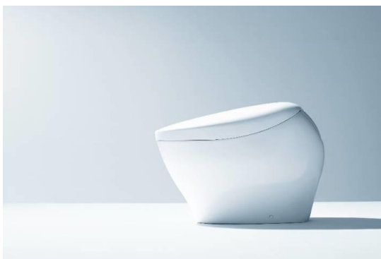
ゴールドセレクション賞を受賞した「ネオレスト NX」

「ネオレスト NX」は、TOTO が世界に向けて発信する次世代トイレとして、ウォシュレット一体形便器の構成をゼロベースで見直し、誕生しました。TOTO が100年培ってきた衛生陶器の技術の粋を尽くし、ウォシュレットの機能部分を包み込むような便器形状の開発に成功。 便器とウォシュレットの区別がなく、デザインと機能が高度に融合した“真の一体形”を実現した、グローバル統一モデル です。2017年8月に日本で発売開始以降、中国、台湾、タイ、ベトナム、アメリカと、世界各地で順次発売しています。