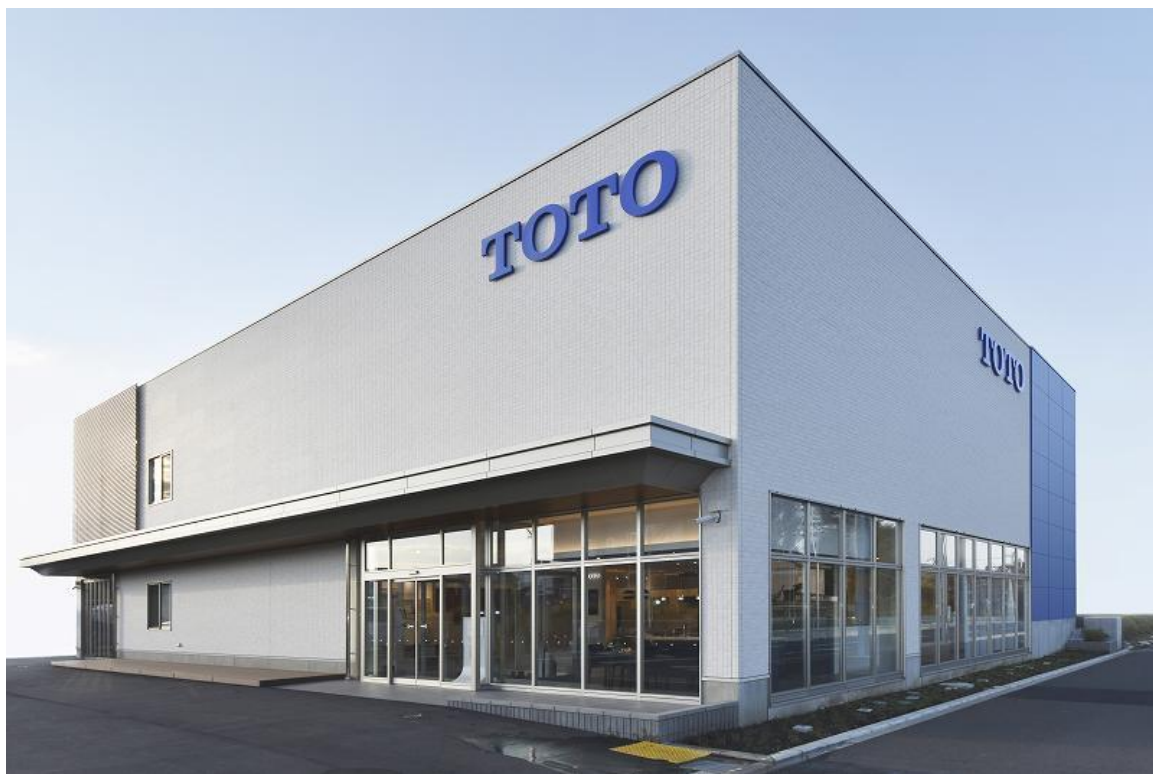
「TOTO藤沢ショールーム」外観写真

※1:リモデルプランの提案や施工からアフターサービスまで総合的にお手伝いする、日本最大級の増改築工事会社ネットワークです。