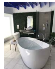
TOTOロサンゼルスショールーム