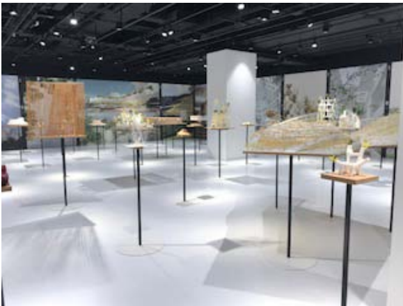
2018年6月～8月 ロンドン展

TOTOギャラリー・間では、今後も建築とデザインの専門ギャラリーとして情報を発信し、国内外の文化向上に貢献していきます。