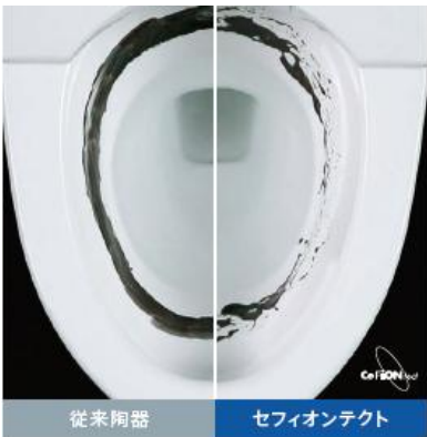
洗浄前 疑似汚物を塗布した段階でセフィオンテクトは汚れをはじき始めています。

陶器表面の凸凹を 100 万分の 1mm のナノレベルでなめらかに仕上げているので、汚れがツルっと落ち、美しさが持続します。また、親水性が高く、水になじみやすいので、汚物を流れやすくします。