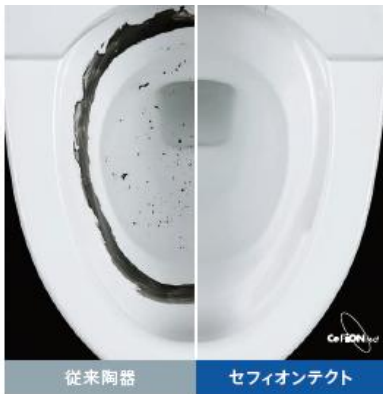
洗浄後 セフィオンテクトは汚れがきれいに落ちます。

<耐久性> 従来釉薬層の上に、高温で溶かした純度の高いガラス層(セフィオンテクト層)を均一に形成しているため、優れた耐久性・耐薬品性があります。