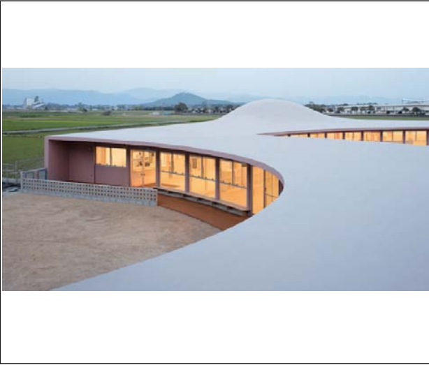
[1] すばる保育園（福岡県、2018年） 保育園での教育の可能性を引き出すため生み出されたコンクリートの連続体。構造最適化設計によって導かれた自由曲面の屋根が、周囲の山並みと呼応する。 設計：藤村龍至／RFA+林田俊二／CFA