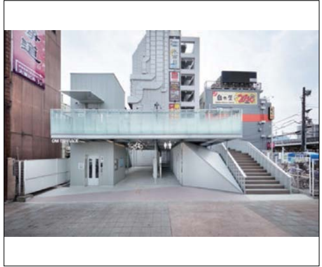
[2] OM TERRACE（埼玉県、2017年） 大宮駅前の再開発用地に計画された小さな公共施設。6回の公開ミーティングを経て、開かれた屋上テラスを提案し、実現した。現在は運営にも携わる。