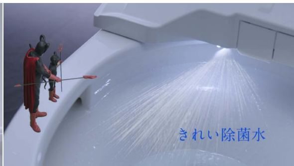
便器ボウル面に「きれい除菌水」が吹きつけられるのを見て、「悲しくなるほど清潔だね」とつづやく子ども