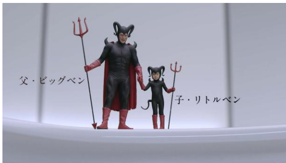
トイレに潜む親子