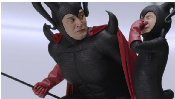
「きれい除菌水」の新機能「においきれい」によって、トイレ空間のにおいまできれいになっていることに苦しむ親子