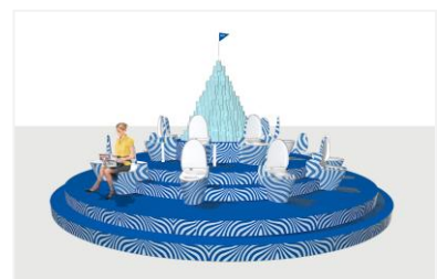
<ネオレストカフェ イメージ図>

東京デザイナーズウィークの「NEOREST×4CREATORS」の一部を展示し、ネオレストカフェ、トイレバイク、トイレ川柳大賞の受賞作品を展示します。11月10日(トイレの日)15時からは、4CREATORSのトークショーも開催します。その他、ネオレストカフェを利用いただいた方に、オリジナル“ネオレストミニどら焼き”をプレゼントなど、楽しい企画を予定しています。(数量限定、なくなり次第終了)