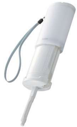
TOTO「携帯ウォシュレット」 品番: YEW350 希望小売価格: ¥11,000(税抜) (税込: ¥11,550)

その後、「トラベル(旅行)」だけでなく、「 赤ちゃんのおしりケア 」や「 海外からの旅行者のお土産品 」として、また震災後は「 停電でも使えるウォシュレット 」としても注目されました。このような状況を受け、 2011年に「携帯ウォシュレット」と名称を変更し、より多くの方々にお使いいただけるよう普及に努めています。