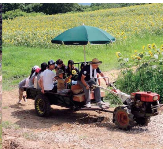
天蓋高原夏祭りでの耕運機体験