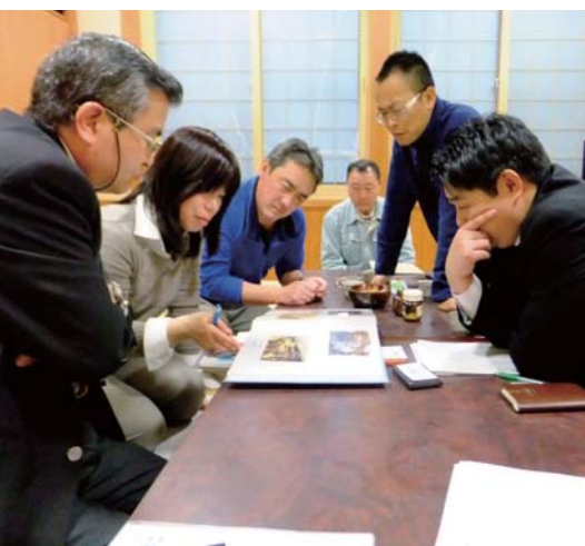
活動の説明を受ける選考委員

新潟県の最北部にある高根は、四方を山に囲まれ豊かな自然の恩恵を受けている。現在の集落戸数は176戸、750人余りの人々が生活しているが、少子高齢化の進行、都市への人口流出、地域産業（林業・農業）の停滞など、徐々に過疎化が進んでいる。源流域の集落の責任として、清流のすばらしさを次世代に引き継げるように子どもたちとともに学ぶことを目的とし、川での自然観察会、棚田を守る活動などを若い世代と行い、交流を通じて集落活性化につなげる。