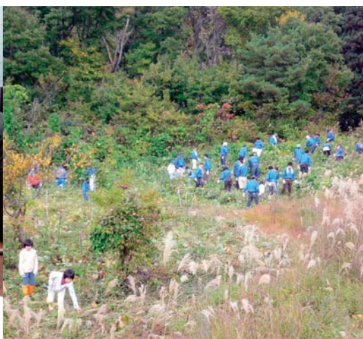
どんぐりの植樹地