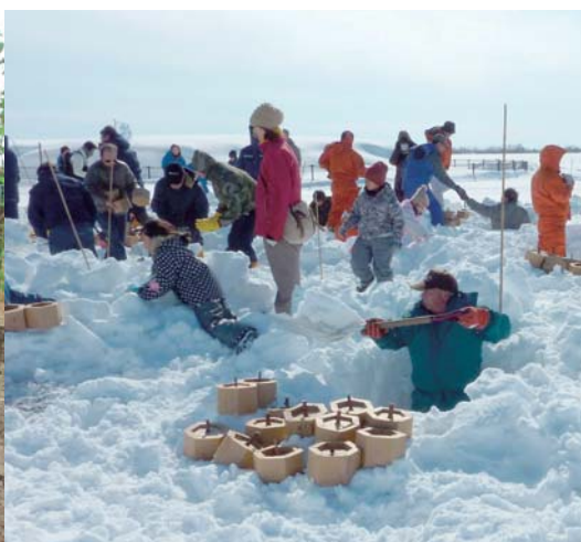
雪中植林作業風景