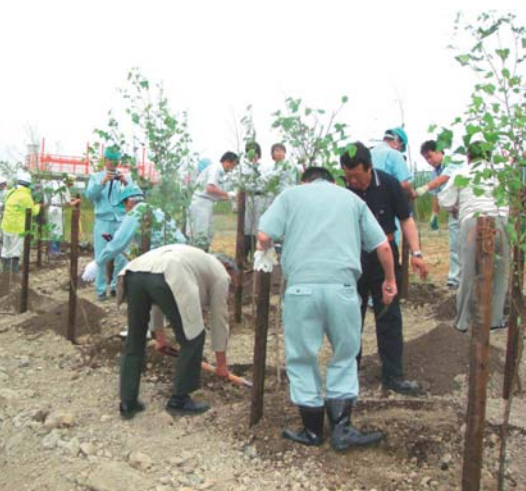
緑の回廊づくり植林

岩見沢市北村は、石狩川流域に位置し、昔から春の雪解け水、夏から秋の台風により毎年水害にあってきた。近年では治水事業が進み被害も減っているが、いつまた自然災害が発生するか分からない。当プロジェクトは官民協働で取り組み、良好な石狩川景観の形成と環境保全を推進し「まちづくり・ひとづくり」に寄与することを目的として活動する。またこの活動から、親子のふれあいや地域の交流の場をつくり、市民の川の環境保全・緑化に対する関心度も高めていく。