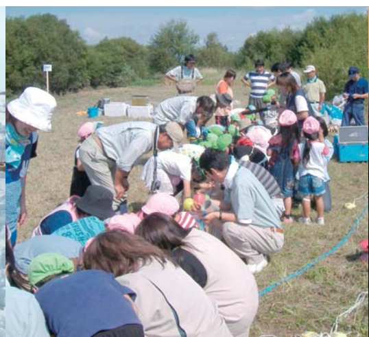
河川調査でミニリバーで遊ぶ園児たち