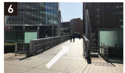
6 デッキを渡り終えた、左側の建物が「JR南新宿ビル」。