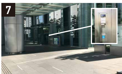
7 入口より建物に入る。(このフロアは2階) (サポートが必要な場合、入口前にあるインターフォンを押してください。防災センターにつながります。)