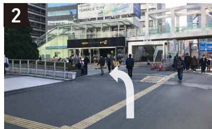
2 左側に見える白い柵を越えて左に曲るとサザンテラスにつながる。(サザンテラスは緩やかな上り坂です。)