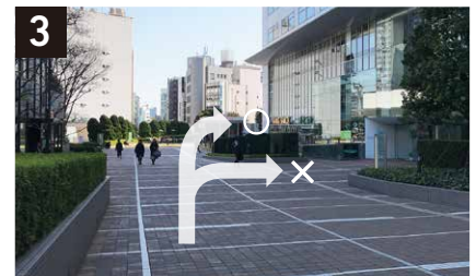
3 左手の「スターバックス」を過ぎ、小田急サザンタワー入口へ進む。(手前のホテル入口は通り過ぎてください。)