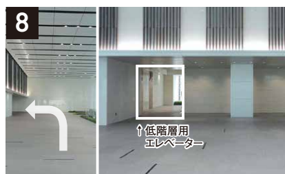
8 ビルに入り、矢印の方向に進む。 (左の低層用エレベーターで6階にお越しください。)