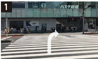
1 JR新宿駅南口より横断歩道をわたり、右へ進む。