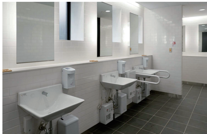
女性トイレ 洗面コーナー

白とグレーを基調とした明るく清潔感のある空間。洗面器は、水じまいのよい壁付自動水栓を組み合わせた壁掛ハイバック洗面器を設置。また、電気温水器やクリンドライ(ハンドドライヤー)も設置されている。