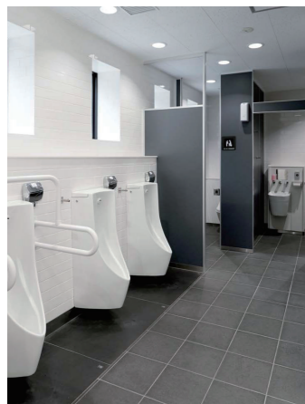
男性トイレ 小便器コーナー 広めのブース

壁掛大便器セット・フラッシュバルブ式:UAXC1CS2AN ウォシュレットPS(擬音装置「音姫」付きエコリモコン):TCF5534A ウォシュレット アプリコットP(温風乾燥付きエコリモコン):TCF584* AUP系 自動洗浄小便器:UFS900R/ハイドロセラフロアPU:AB690BR 壁掛ハイバック洗面器:LSA135CN/自動水栓一体形電気温水器:REAH03B1R コンパクト・バリアフリートイレパック:UADAK21L1A1ADD2WA コンパクトオストメイトパック:UAS81LDB2NW/収納式多目的シート:EWC520AR系 パウチ・しびん洗浄水栓付背もたれ:EWC5802R