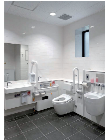
バリアフリートイレ

重要なサインなどを際立たせるグレーカラーを、駅の内外に適用する色として設定。ひと目で入口や配慮対象者への設備がわかる、視認性の高いサインを採用。トイレ案内を兼ねた触知図と音声案内も設置されている。