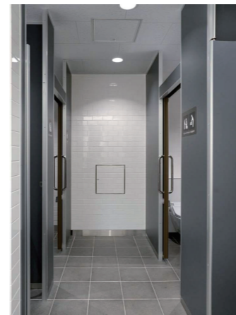
女性トイレ 大便器コーナー

女性トイレのパウダーコーナーには、鏡に近づいて化粧直しやすく、間接照明が落ち着きを与えるLED照明付鏡(間接照明タイプ)を設置。また、傘や杖を掛けやすいように相鉄オリジナルのフックを設置している。