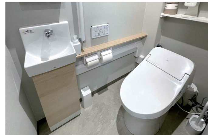
スタッフ用トイレ

運動療法に対応できる十分な広さを確保したリハビリテーション室には、ステンレス製のシンクを設置。自動水栓を組み合わせ、非接触で手洗いでできる衛生的な環境を整えている。