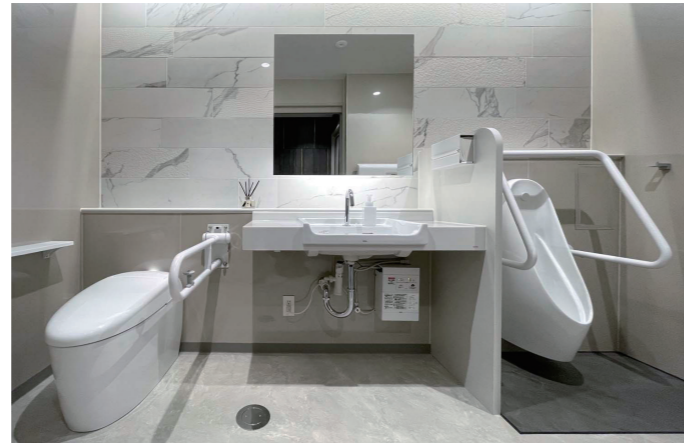
バリアフリートイレ

女性専用の個室トイレを設け、快適に利用できるよう配慮。高級感とともに、柔らかなフォルムがやさしい雰囲気のウォシュレット一体形便器 ネオレストRSを採用している。