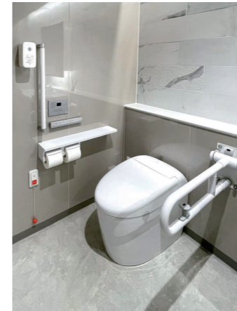
バリアフリートイレ

左側に手すり付きの大便秘器、右側に小便秘器を配置し、間隔をとって、清潔感に配慮。手を差し入れやすい“切り欠き形状”のセルフリング式洗面器は、手洗いがやすく、車いす利用者にも使いやすい配慮がなされている。