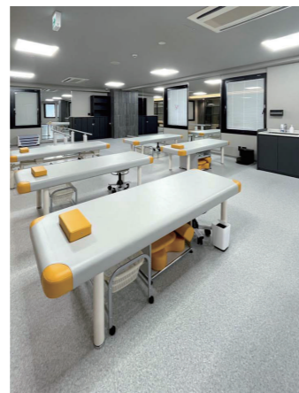
リハビリテーション室

シンクには、スパウト先端でソフト(泡まつ)とシャワーに切り替えられるシングル混合水栓を採用。水とお湯の切り替えをレバーのクリック感で明確にするエコシングルの採用により、お湯のムダ使いを防げる。