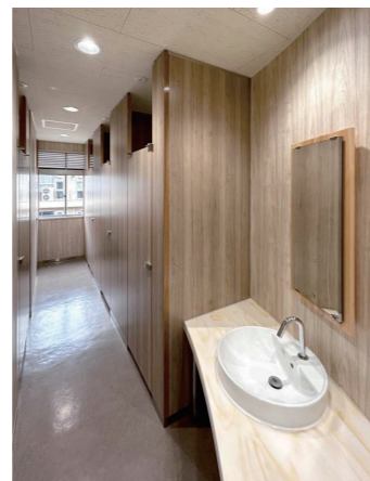
管理棟 2F女子トイレ 大便器ブース

女子トイレの洗面コーナーは、緩やかなカーブを描いたマーブル模様のカウンターが柔らかな印象を与える空間。広めの洗面カウンターには、ベッセル式洗面器と非接触で手洗いができる自動水栓を採用している。