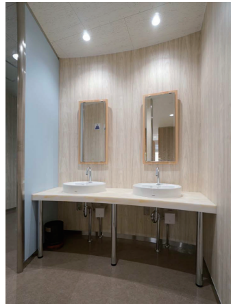
管理棟 2F男子トイレ 洗面コーナー

リラックスできる場所として、洗面コーナーを広めに設計。木目調を基調とした壁に、入口の壁面のみ淡いブルーカラーとし、女子トイレではピンクとなっている。鏡は隣人の映り込みに配慮し、個別鏡を設置している。