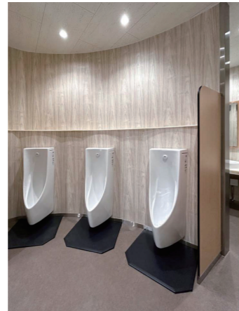
管理棟 2F男子トイレ 小便器コーナー

リラックスできる場所として、洗面コーナーを広めに設計。木目調を基調とした壁に、入口の壁面のみ淡いブルーカラーとし、女子トイレではピンクとなっている。鏡は隣人の映り込みに配慮し、個別鏡を設置している。