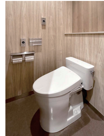
管理棟 2F男子トイレ 大便器ブース

空間を柔らかく演出するR形状のライニングに沿って小便器が並び、その対面にマーブル模様のベンチを設置。荷物を置いたり、座って待つなど、生徒が多用途に使えるよう工夫が凝らされている。