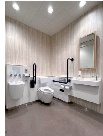
管理棟 1Fバリアフリートイレ

各トイレ入口では、鴻巣市の地場産業である「ひな人形」をシンボルとしたピクトサインが出迎えてくれる。また、職員室の近くにバリアフリートイレを新設。内部の設備がひと目でわかるサインも表示している。