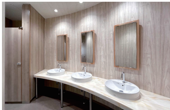
管理棟 2F女子トイレ 洗面コーナー

1Fは、来校者が使用することを想定し、職員室の近くにバリアフリートイレと男女トイレを配置。2・3Fでは、生徒の利用を想定して、既存の器具数から、女子トイレの大便秘器と洗面器を各1台ずつ増設している。また、トイレに入りづらいと感じる生徒に配慮し、人を自然に迎え入れるようなR形状の壁や、丸みを帯びたデザインを意識して採用、温かみのある優しい空間としている。さらに、広めの洗面コーナーや、ベンチを設けた男子トイレなど、生徒がリラックスして利用できる配慮が随所になされている。器具は、生徒が掃除しやすいように、手入れのしやすさや汚れの付着しにくい陶器の便器であることや、非常時にも対応できる器具にするなど、学校関係者の声などを反映し、慎重に選定されている。