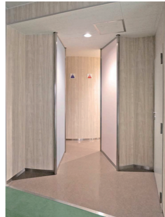
管理棟トイレ入口

埼玉県中央に位置する鴻巣市。その北部にある「鴻巣市立鴻巣北中学校」は、1974(昭和49)年に創設。このたび、避難所に指定されている体育館からも近い管理棟において、老朽化したトイレの改修を実施した。