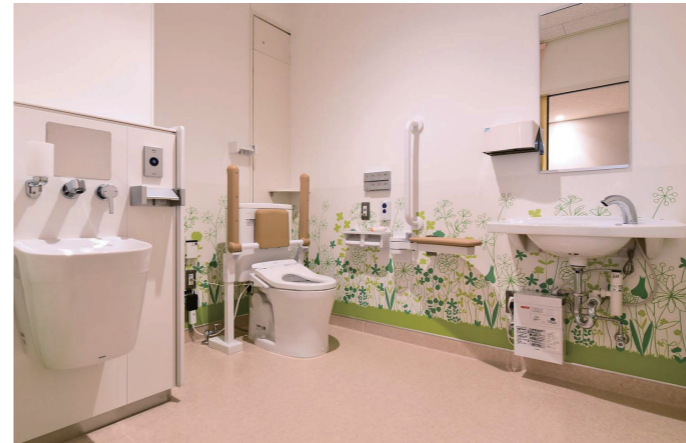
5F東病棟 バリアフリートイレ

看護師の要望を受け、患者さんの便座からの立ち上がりを検知し、スタッフにいち早く知らせるトイレ離座検知システムを導入。同機能に特化したウォシュレットと前方ボードを採用し、転倒リスクを低減している。