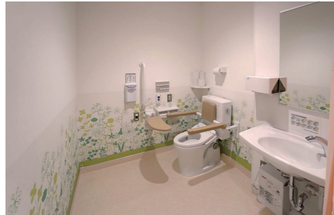
5F東病棟 バリアフリートイレ

身体状況に配慮して左右勝手違いのブースを用意。座位姿勢を支えて介助負担を軽減するトイレ用手すり(はね上げタイプ)や、ボタンを押すたびに発電し電源工事や乾電池の交換が不要なエコリモコンを設置している。