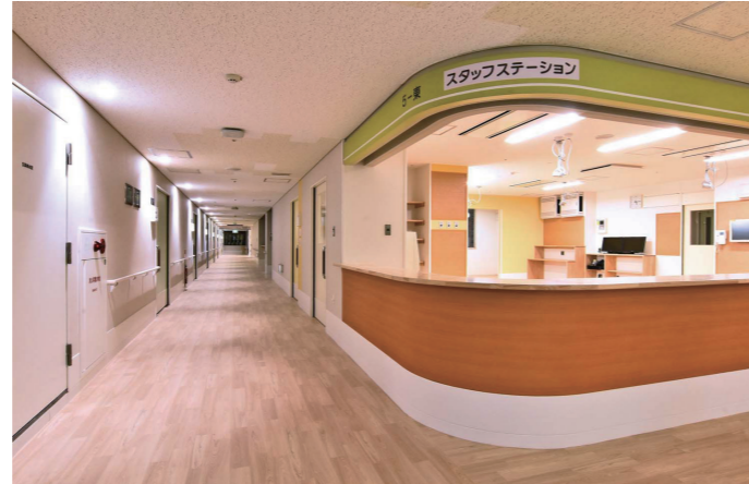
5F東病棟 スタッフステーション

長野県南信州地域に位置する「飯田市立病院」は、1992(平成4)年に現所在地へ移転。その後、増築を重ねてきたが、2019(令和元)年からは施設長寿命化計画に則り、老朽化した病棟の全面リニューアルを実施。