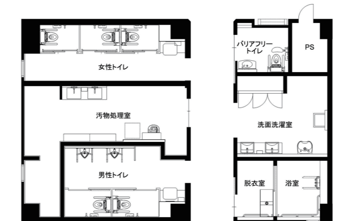
5F東病棟 改修後トイレ図面