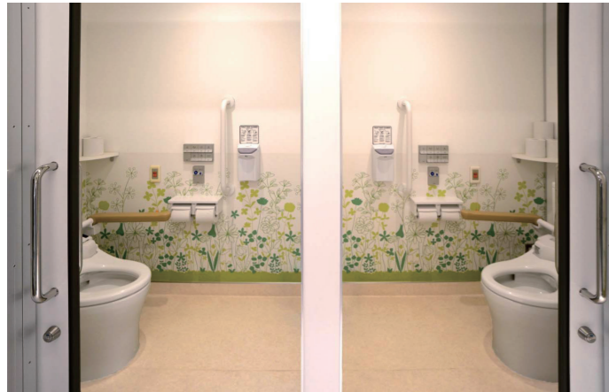
5F東病棟 女性トイレ 大便器ブース

改修前の床タイルや床置小便器は掃除がしづらく、清掃担当者から不満の声が多かった。さらに、狭いブースは点滴スタンドでの利用がしづらく、座位の安定や介助するサポート器具も少なかったため課題となっていた。