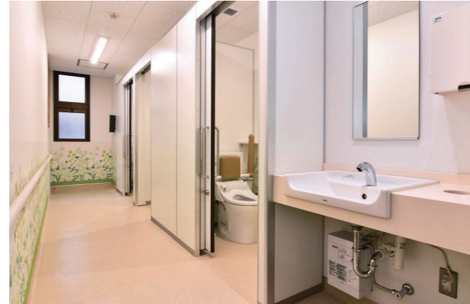
5F東病棟 女性トイレ 全体

老朽化が目立っていた壁床内装材の全面張り替えやLED照明器具への変更により、暗く冷たい印象だった病棟は、明るく親しみやすい空間へ生まれ変わった。スタッフの労働環境改善や業務負荷軽減にも取り組んでいる。