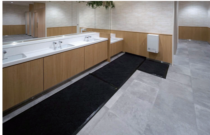
1F 女性トイレ 洗面コーナー

通路幅を2500mm程度とり、車いす同士でもすれ違えるよう、ゆとりのある空間を確保。また、通路内には、ドリンクの自販機もあり、休憩や待ち合わせに利用できる大型のベンチを設けている。