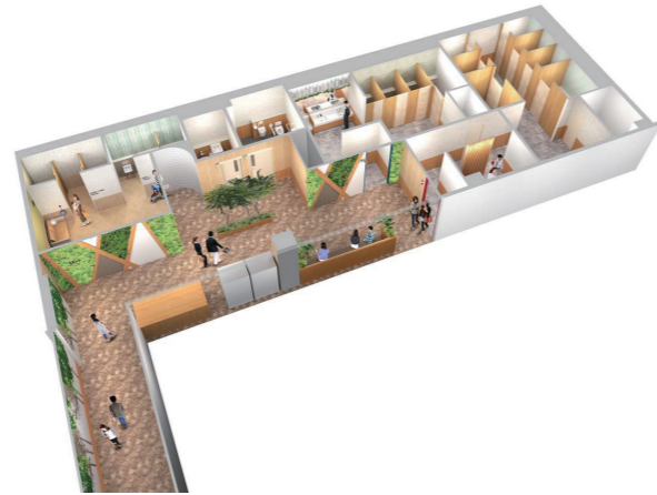
1F トイレ内観パース

2023(令和5)年7月、福岡県飯塚市に新たな商業施設「ゆめタウン飯塚」がグランドオープン。「待ち遠しいMIRAIを創ろう」をコンセプトに、新たな出会いと体験、地域のMIRAIが生まれる交流拠点を目指している。