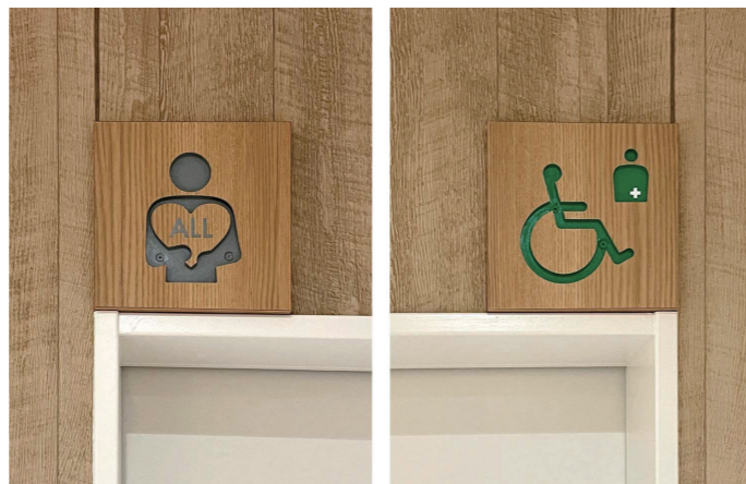
1F オールジェンダートイレ・ バリアフリー専用トイレ

バリアフリー専用トイレとは別に、男女共用のオールジェンダートイレを隣接して設置。バリアフリー専用トイレが混んでいる場合や、介助が必要な方、性別を問わずに使用したい方のための配慮がなされている。