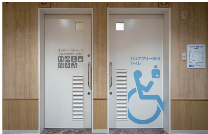
1F オールジェンダートイレ・ バリアフリー専用トイレ

シンプルなデザインで、清掃がしやすい壁掛け型の自動洗浄小便器を採用。インターバル排水管洗浄や節水トラップにより、尿石やアンモニアの発生を抑制しながら、大幅な節水を実現している。