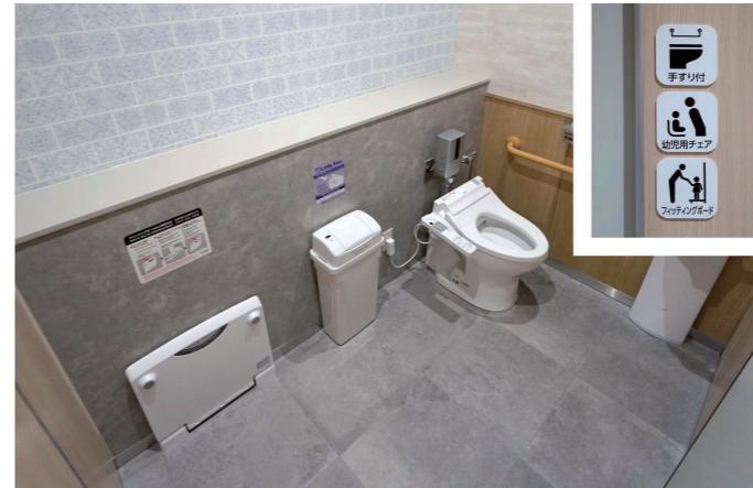
1F 女性トイレ ひろびろブース

ゆっくり身繕いできるように設けられたスタイリングコーナーは、洗面コーナーの混雑緩和も図られている。鏡は個別鏡とし、隣人と鏡越しに目があわないように配慮されている。