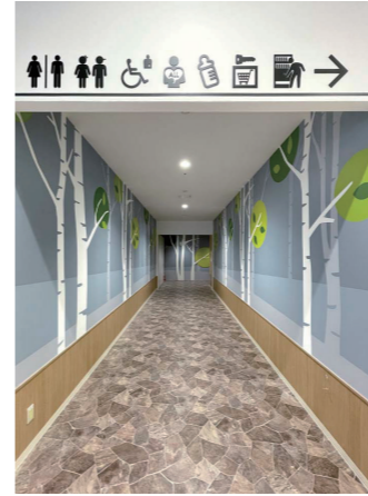
1F トイレアプローチ

1Fトイレは「Forest Garden～自然に包まれた癒しの空間」をコンセプトに計画。トイレは、フロアやゾーンの特性にあわせて、デザインの方向性や機能、サービスなどの充実を図っている。