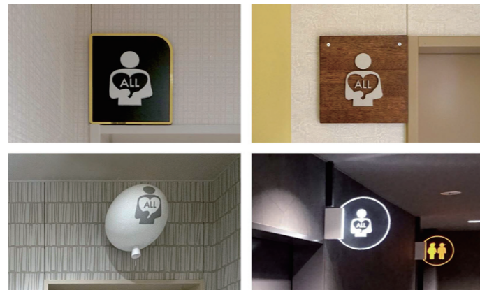
オールジェンダートイレ サイン

2Fトイレまでの通路には、「ゆめタウンのサステナビリティの取り組み」を紹介するパネルが掲示され、同施設が、希望あふれる持続可能な未来を目指して、積極的にアクションをしていくことを宣言している。