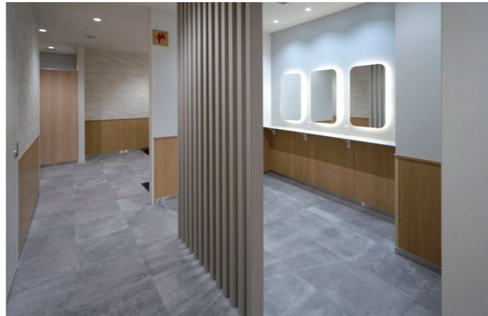
1F 女性トイレ スタイリングコーナー

荷物の置き場に配慮したドライエリア付きのツインデッキカウンターを採用。1ヶ所はお子様の利用を考慮し、カウンター高さを600mmに設定。また、清潔な手洗いを実現するために、自動水栓と水石けんを設置している。