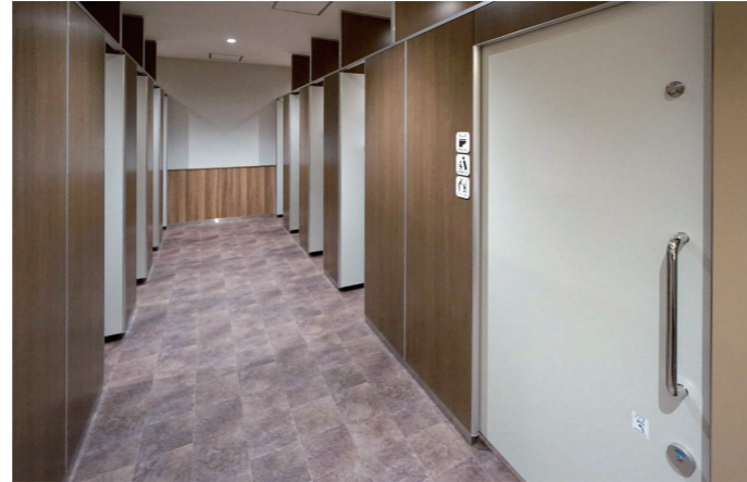
2F 女性トイレ 大便器コーナー

キッズトイレには、幼児の自立をサポートする幼児用大便器と幼児用小便器を採用。電気温水器がセットされた洗面器は、あふれ面の高さを500mm程度に設定し、お子様が自分で、清潔に手洗いができるように配慮している。