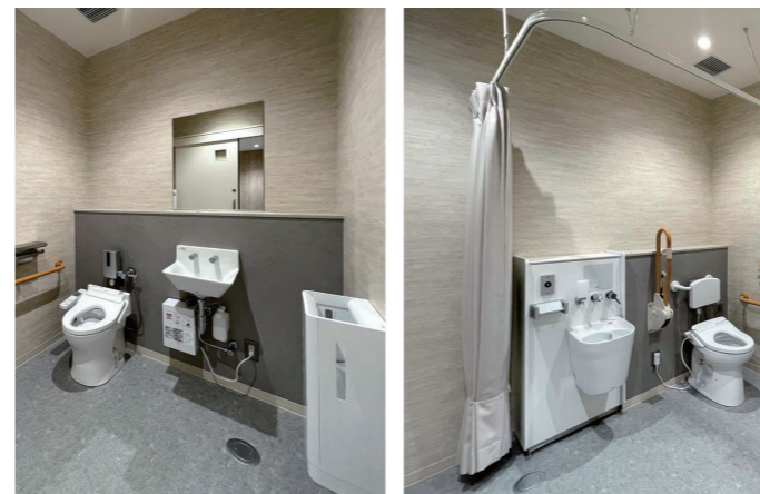
1F オールジェンダートイレ・ バリアフリー専用トイレ

1Fトイレには、空間コンセプトを踏襲した木彫りの温かみのあるサインを掲示。トイレ各所には、それぞれのエリアの空間意匠にあわせた、施設オリジナルのサインが用いられている。