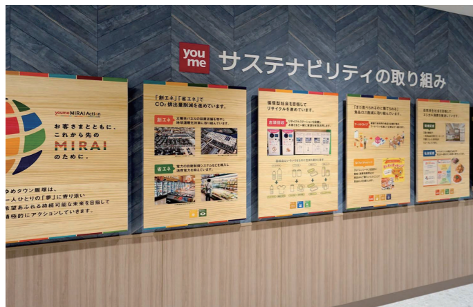
サステナブルパネル

間接照明を取り入れた洗面コーナーや、隣接して設けられたスタイリングコーナーには、多人数の利用に対応できるよう全面鏡を採用。空間の意匠にあわせ、斜めに切り取ったデザインとしている。