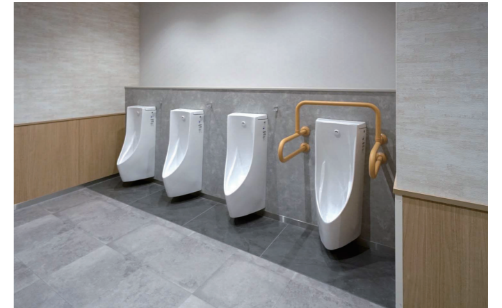
1F 男性トイレ 小便器コーナー

1700mm×2100mmの広さを確保し、ベビーカーやカートとともに入ることができるひろびろブースには、乳幼児連れの設備を充実。女性トイレに2ヶ所設置。男性トイレにも同設備を備えたブースを1ヶ所設置している。