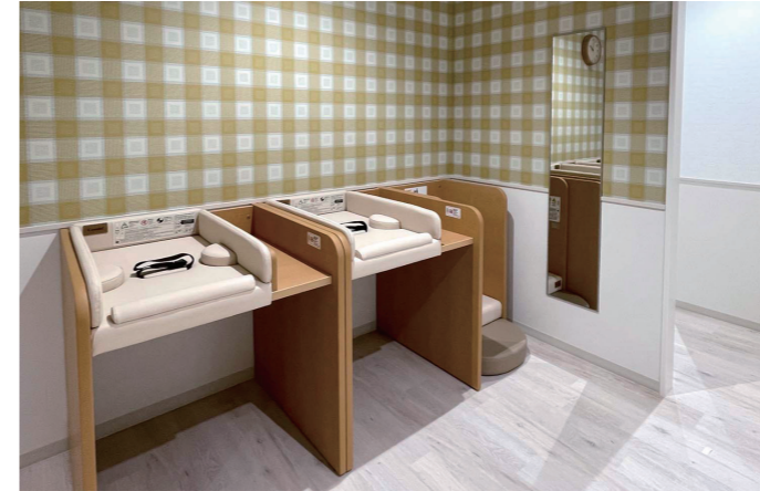
2F おむつ替えコーナー

大便器ブースの間仕切り壁を天井まで立ち上げ、防犯性を高めている。また、ひろびろブースには、お子様が不意に開錠してしまうのを防ぐため、お子様の手が届かない高さにもう1ヶ所鍵を設置している。