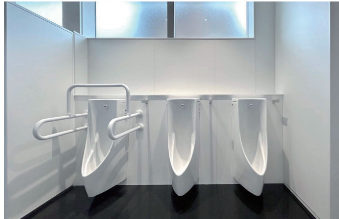
男性トイレ 小便器コーナー

地上10階、地下1階の草加市新庁舎は、2023(令和5)年3月に竣工。連続する平入りの屋根のデザインモチーフが、旧日光街道の宿場町である草加宿の趣を感じさせる。歴史をつなげる新たなシンボルとして計画された。