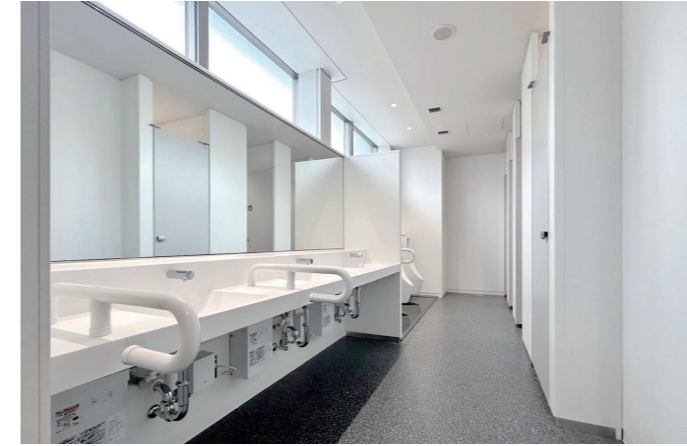
男性トイレ 洗面コーナー

子育てのフロアがある3Fトイレには、お子様連れ配慮として、ひろびろブースを1ヶ所設置。ベビーカーのまま入れるスペースを確保し、ベビーシートやベビーチェア、フィッティングボードが設置されている。