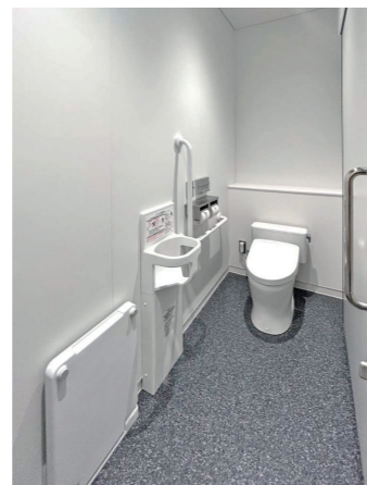
男子トイレ ひろびろブース

2F大便器ブースの1ヶ所には、便座が電動で昇降するトイレリフトを設置し、トイレへの着座や立ち上がりをサポート。昇降はスイッチ操作時のみ作動し、希望の高さで停止する。