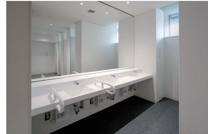
女性トイレ 洗面コーナー

壁面上部の窓から光が降り注ぐ、明るい空間。入口側の洗面器には、さまざまな利用者に配慮して手すりを設置。また、非接触で衛生的に手洗いできるよう、自動水栓と電気温水器を採用している。