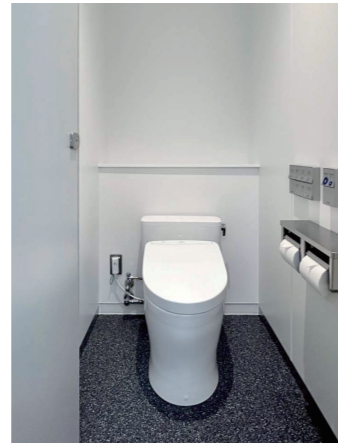
男性トイレ 大便器ブース

福祉のフロアがある2Fトイレ入口には、廊下に点字ブロック、壁に案内板と触地図を設置。男女トイレには、それぞれお子様連れに配慮した大便器ブースが設けられ、それを示すピクトサインを掲示している。