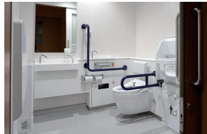
バリアフリートイレ

車いす使用者や、お子様連れに配慮してベビーチェアやフィッティングボードを備えたコンパクト・バリアフリートイレパックを設置。そのほか、ベビーシートも完備している。