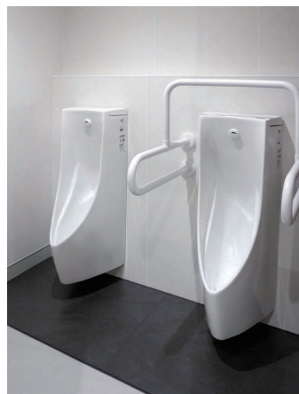
男性トイレ 小便器コーナー

小便器は、シンプルなデザインと節水機能を両立し、清掃性にも優れる壁掛型の自動洗浄小便器を採用している。