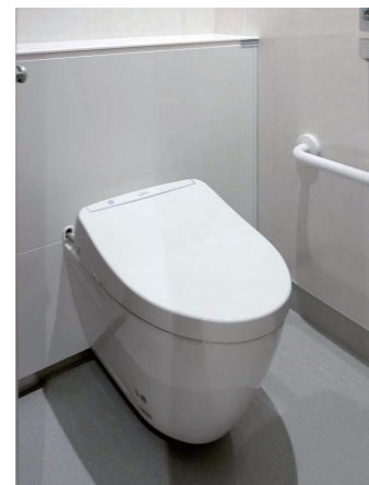
女性トイレ 大便器ブース

小便器は、シンプルなデザインと節水機能を両立し、清掃性にも優れる壁掛型の自動洗浄小便器を採用している。