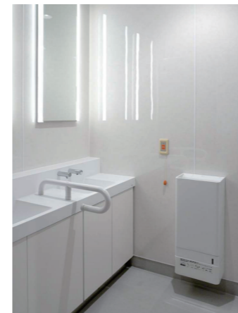
男性トイレ 洗面コーナー

車いす使用者や、お子様連れに配慮してベビーチェアやフィッティングボードを備えたコンパクト・バリアフリートイレパックを設置。そのほか、ベビーシートも完備している。