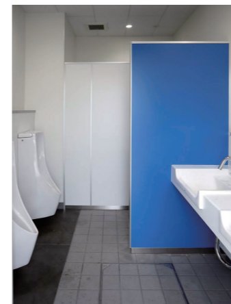
ドライバー専用トイレ

運送会社のドライバー用に駐車場から出入りできるトイレを設置。近年女性ドライバーも増えていることから、女性トイレも設置している。