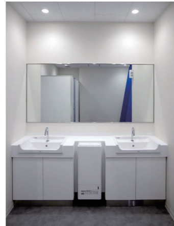
事務所棟2F 男性トイレ 洗面・小便器コーナー

事務所棟のトイレ入口の扉は、感染症対策として手先を用いず、肘などでボタンを押すことにより開閉ができる自動扉を採用している。