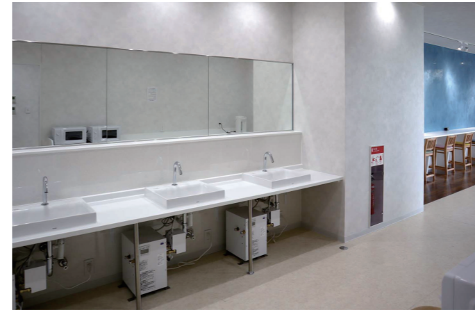
事務所棟2F 休憩室 手洗いコーナー

休憩室には手洗いコーナーが設置されており、食事前後などに手が洗えるように配慮。さらに、しっかりと手が洗えるように電気温水器も設けられている。