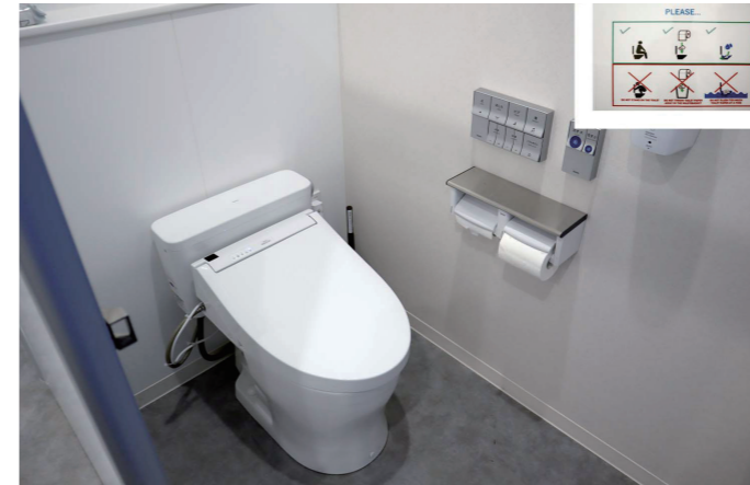
事務所棟2F 男性トイレ 大便器ブース

大便器は奥行きがコンパクトで、連続洗浄可能なパブリックコンパクト便器・フラッシュタンク式を採用。また、外国人の従業員に向けて、トイレの使い方の注意を英文で掲示している。