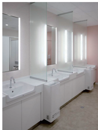
事務所棟 女性トイレ

大便器は奥行きがコンパクトで、連続洗浄可能なパブリックコンパクト便器・フラッシュタンク式を採用。また、外国人の従業員に向けて、トイレの使い方の注意を英文で掲示している。