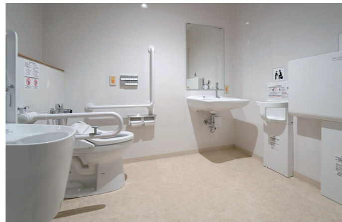
校舎西棟1F バリアフリートイレ

A棟1Fのバリアフリートイレには、車いす利用者やお子様連れ、オストメイトなど、さまざまな利用者に対応できる設備を完備している。