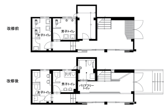
体育館トイレ図面

洗面器は、手を差し込みやすい深型タイプのボウルを採用。また、非接触で水の出し止めができる自動水栓は、電気工事が不要で、停電時にも作動する電源不要の自己発電タイプを採用している。