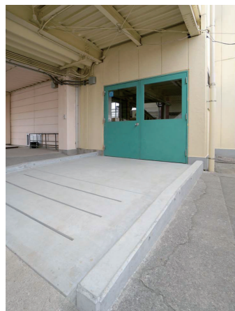
体育館 バリアフリートイレ

小中学校トイレ洋式化事業における基本方針より、トイレは「洋式便器に変更」と「乾式清掃化」を実施。また制約が多い改修工事のなか、既存の電力容量の範囲内で、温水洗浄便座を各トイレに1ヶ所ずつ設置。加えて、衛生面にも配慮し、洗面コーナーには自動水栓、小便器は床の清掃がしやすい壁掛型の自動洗浄小便器を採用している。また、災害時の避難所となる体育館には、器具庫を改修してバリアフリートイレを新設。屋外からは、昇降口からトイレまでの段差をスロープでアプローチできるようにしている。さらに校舎棟トイレにも女子トイレの一部を活用するなどして、バリアフリートイレを新設。教育施設として、地域の拠点として、多様な利用者に配慮した、安心で充実したトイレ環境が整備された。