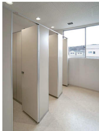
校舎西棟トイレ 大便器ブース

清掃は乾式清掃へと変更し、残っていた和式便器もすべて洋式便器に変更。男女トイレともに1ヶ所ずつ、擬音装置「音姫」付きのウォシュレットPを備え付けている。