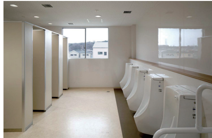
校舎西棟トイレ 全体

八国山を背に、豊かな自然と下宅部遺跡など文化遺産に囲まれる地域に位置する「東村山市立東村山第四中学校」。このたび、校舎西棟・北棟と体育館のトイレを全面改修。改修歴のある校舎南棟は部分改修を行った。