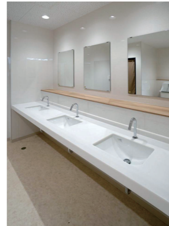
校舎西棟トイレ 洗面コーナー

自然光が射し込む明るく清潔感のある空間。各コーナーのライニングには木目調を用い、温かみを感じられる内装としている。小便器は、床の清掃性や節水性に優れた壁掛型の自動洗浄小便器を設置している。