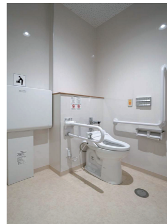
校舎北棟2F バリアフリートイレ

A棟1Fのバリアフリートイレには、車いす利用者やお子様連れ、オストメイトなど、さまざまな利用者に対応できる設備を完備している。