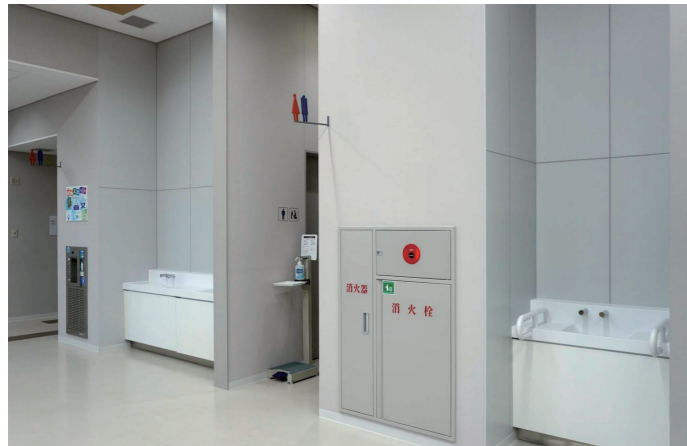
1F多目的スペース 手洗いコーナー

屋上には太陽光パネルを設置し、照明や災害時の電力として利用。屋上緑化は、断熱や冷却効果により空調負荷を低減。また免震構造の採用や非常用発電機の設置など、災害発生時に対応できる機能を確保している。