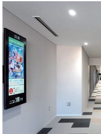
デジタルサービス

無人決済システムを導入した1Fコンビニエンスストアの横には、飲食可能な多目的スペースを設置。市民広場やランチテラスと一体的に利用も可能。また食事前後などに手洗いできる手洗いコーナーも設けている。