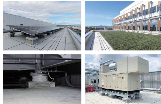
環境配慮・防災対策

屋上には太陽光パネルを設置し、照明や災害時の電力として利用。屋上緑化は、断熱や冷却効果により空調負荷を低減。また免震構造の採用や非常用発電機の設置など、災害発生時に対応できる機能を確保している。