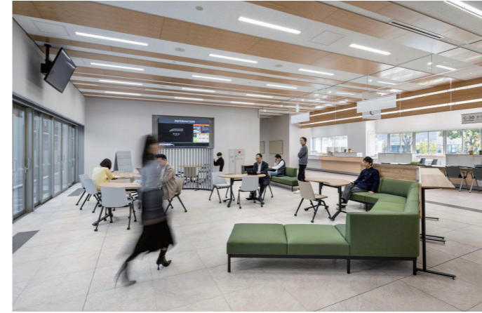
1F市民協働スペース

1Fホールの総合案内カウンターには、目に付きやすく、だれもが認識できるように、清酒発祥の地をシンボリックに表現する酒樽を用いた。利用者が、目的地に視覚的に導かれるよう、視認性のよい施設配置としている。