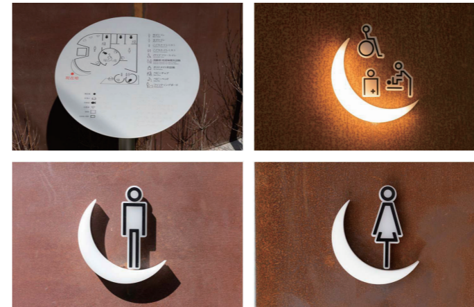
案内板・ピクトグラム

円形の空間を生かしつつ、さまざまな利用者に対応した器具を完備。オストメイトに必要な器具がパッケージされたコンパクトオストメイトバックのそばには、着替えができるフィッティングボードと姿見も設置している。