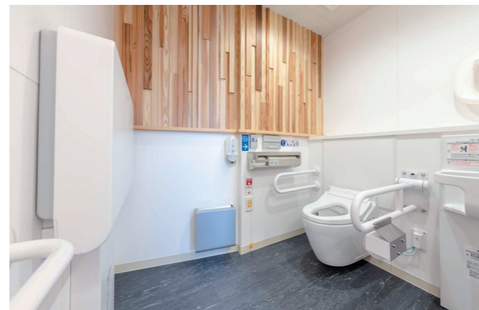
女性トイレ おおきめブース

親子が入った際に、お子様が鍵を開けてしまうことがないように、すべてのブースに高さ違いで2ヶ所鍵を設置している。