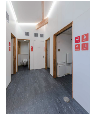
女性トイレ 大便器コーナー

洗面コーナーには、衛生面に配慮して非接触で使用できる自動水栓と自動水石けん供給栓を設置。さらに、パウダーコーナーを設けることで、お化粧直しや身づくろいに配慮している。