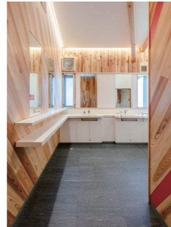
女性トイレ 洗面・パウダーコーナー

各トイレ入口には、トイレ内の設備を確認できるピクトサインと、訪日外国人への配慮から5ヶ国語表記の案内図を掲示している。