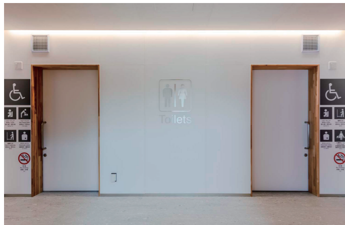
バリアフリートイレ 入口

片マヒの方などに配慮し、入口の引戸位置まで統一させ、左右勝手違いで設けたバリアフリートイレ。入口には、ブース内の設備を確認できるピクトサインと5ヶ国語表記を掲示している。