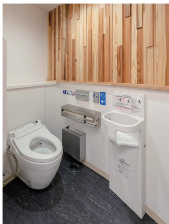
大便器ブース (男女共通)

各大便器ブースの入口には、ブース内の設備を確認できるピクトサインを掲示している。