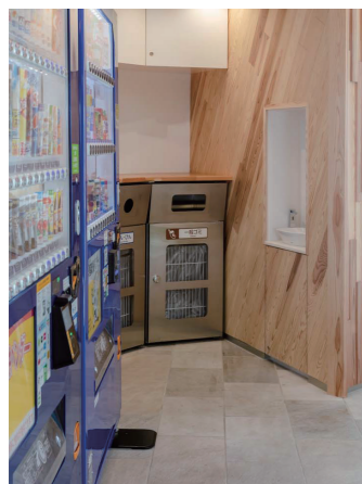
自動販売機コーナー

一方のバリアフリートイレとは異なる使い勝手に配置したバリアフリートイレ。車いす使用者やオストメイト、お子様連れに配慮している。