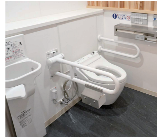
男性トイレ おおきめブース

清掃性とメンテナンス性に優れた壁掛型の自動洗浄小便器を採用。さらに、小便器の間に仕切りを設けることでプライバシーに配慮している。また、フックを設置することで傘やつえ、手荷物にも配慮している。