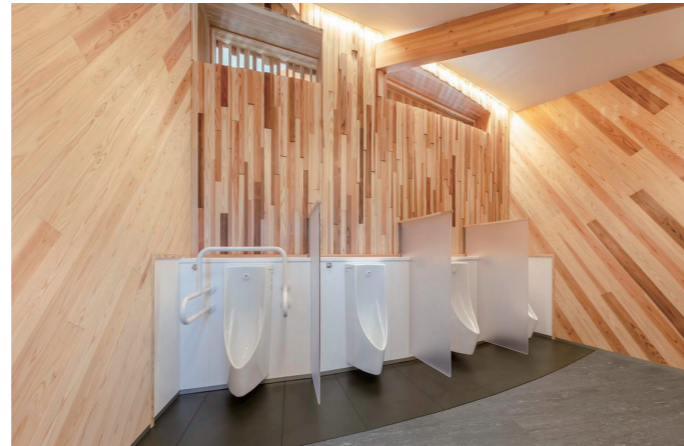
男性トイレ 小便器コーナー

リフレッシュのため洗顔もできるように配慮した、広いボウル面が特徴の壁掛洗面器を設置。