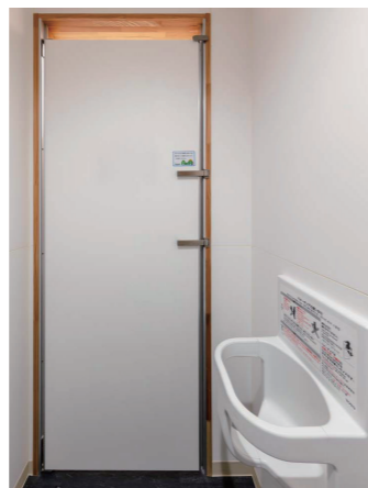
大便器ブース (男女共通)

大便器は、清掃性に配慮した壁掛大便器セット・フラッシュタンク式を採用。さらにウォシュレットのリモコンは電力不要のエコリモコンを設置。また、お子様連れに配慮して全ブースにベビーチェアを設置している。