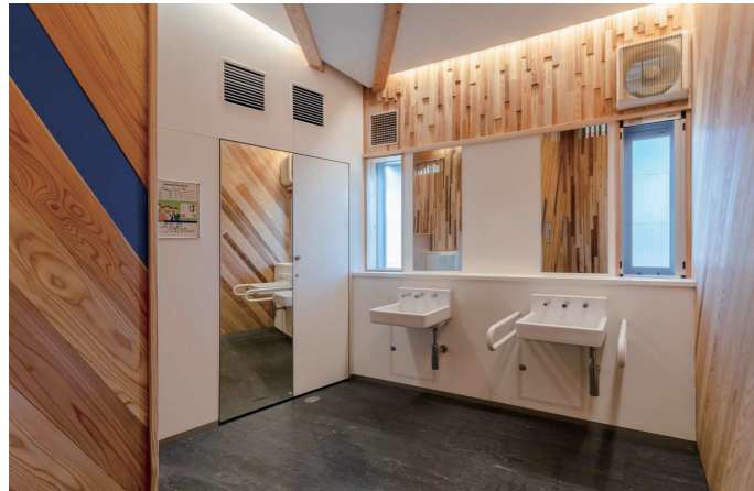
男性トイレ 洗面コーナー

リフレッシュのため洗顔もできるように配慮した、広いボウル面が特徴の壁掛洗面器を設置。