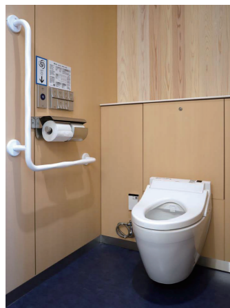
大便器ブース (男女共通)

壁掛大便器セット・フラッシュタンク式:UAXC3CS1AN ウォシュレットPS(擬音装置「音姫」付きエコリモコン):TCF552*系 ウォシュレットPS(温風乾燥付きエコリモコン):TCF555*系 スベア付紙巻器:YH150 R/L S/自動洗浄小便器:UFS900JCS 洗面器:L505/壁掛洗面器:L270CM/埋込手洗器:LSE570APR 台付自動水栓:TLE26702J/自動水石けん供給栓:TLK06S03J クリーンドライ(ハンドライヤー):TYC420W、TYC320W コンパクトオストメイトパック:UAS81LNB2NW 背もたれ:EWC282特/パブリック用折りたたみシート:EWC500系 ベビーチェア:YKA15系/ベビーシート:YKA25系/フィッティングボード:YKA41系