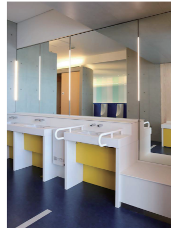
男性トイレ 洗面コーナー