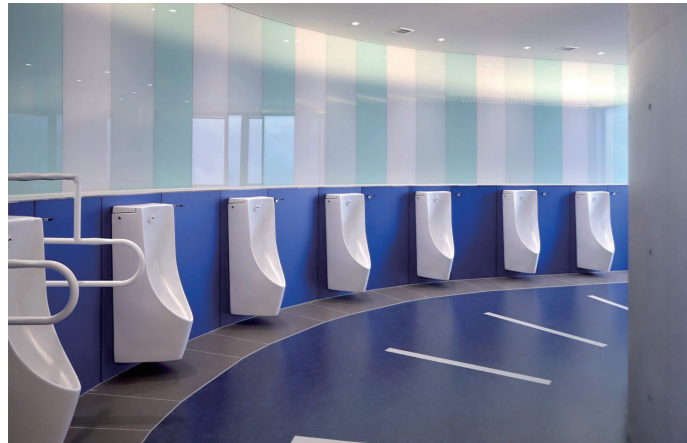
男性トイレ 小便器コーナー

アール状の壁に沿って器具が設置された小便器コーナー。小便器は床の清掃性や節水性に優れた壁掛型の自動小便器を設置。手荷物配慮として棚やフックを設けている。